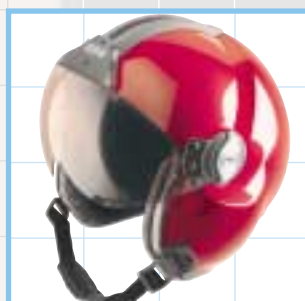
LH 250 Equipé de deux écrans au choix

■ Système de guidage de l'écran extérieur avec 6 positions basses verrouillées.