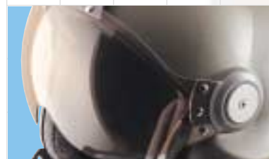
Différentes combinaisons de couleurs d'écrans disponibles