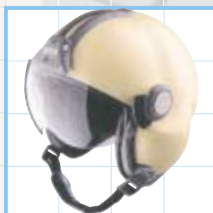
LH 150 Equipé d'un écran extérieur au choix