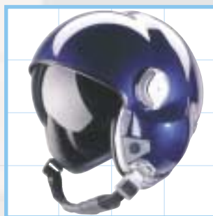
LH 050 Equipé d'un écran intérieur au choix