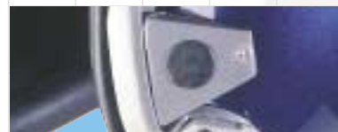
Nombreux systèmes de communication disponibles