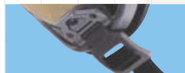
Différents systèmes de rétention disponibles