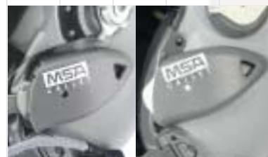
Option disponible : Crémaillères de fixation pour masque oxygène