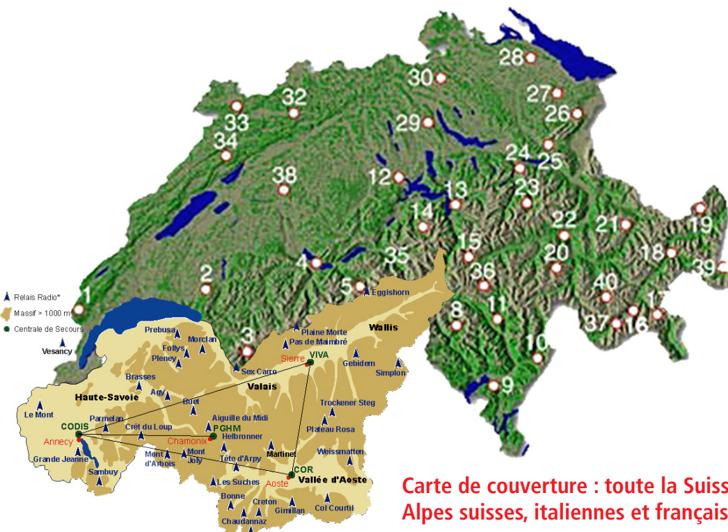
Carte de couverture : toute la Suisse + Alpes suisses, italiennes et françaises